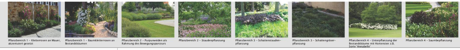
Pflanzbereich 1 – Kletterrosen an Mauer, akzentuiert gesetzt Pflanzbereich 1 – Baumkletterrosen an Bestandsbäumen Pflanzbereich 2 – Purpurweiden als Rahmung des Bewegungsparcours Pflanzbereich 2 – Staudenpflanzung Pflanzbereich 3 – Schattenstaudenpflanzung Pflanzbereich 3 – Schattengräserpflanzung Pflanzbereich 4 – Unterpflanzung der Bestandsbäume mit Hortensien z.B. Sorte 'Annabelle' Pflanzbereich 4 – Saumbepflanzung

Parkanlage Adolf-Metzner Entwurf Variante 2 M 1:200