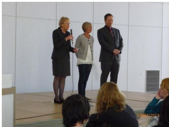
... die Eröffnung ...

Das Internationale Frauenfrühstück blickt in Frankenthal auf eine lange Tradition zurück. Als beliebter Treffpunkt für Frauen unterschiedlicher Kulturkreise ist es aus dem städtischen Veranstaltungskalender nicht mehr weg zu denken.