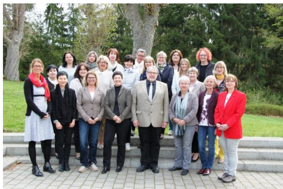
... zu Gast in Montabaur ...

Lesen Sie dazu auch die Anlagen 9 und 10.