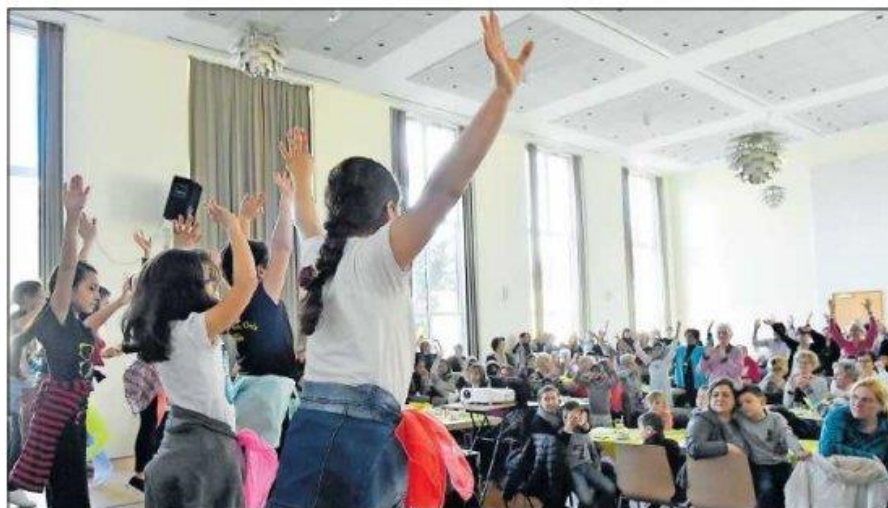
Brachten Bewegung in den Saal: die Kids in Action und die Tanzgruppe Dance Passion.

Am Frühstücksbüfett herrschte dichtes Gedränge, denn die Tafel war reich gedeckt mit köstlichen internationalen Delikatessen. In Gruppen saßen Frauen aus den verschiedenen Nationen zusammen und unterhielten sich angeregt; sie kamen aus Län-