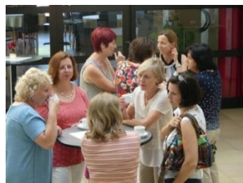
... beim Netzwerken ...