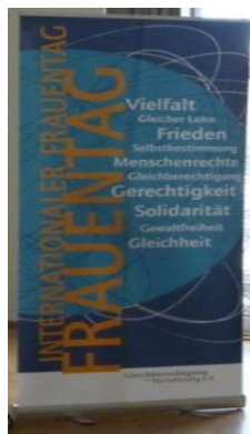
... das Logo ...