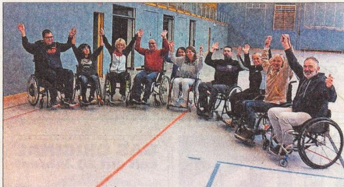
Nach der Veranstaltung waren sich die Teilnehmer sicher: Sie haben viel dazugelernt.

Eingeladen zum kostenlosen Rollstuhltraining hatten die Be-