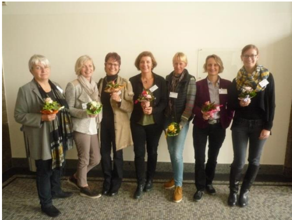
... Neuwahl der LAG-LGG-Sprecherinnen ...

Die Gleichstellungsbeauftragte vertritt in der Landesarbeitsgemeinschaft der behördlich wirkenden Gleichstellungsbeauftragten in Rheinland-Pfalz (LAG-LGG) als eine von sieben Sprecherinnen seit 2010 die Interessen der ca. 450 rheinland-pfälzischen Gleichstellungsbeauftragten, die auf der Grundlage des Landesgleichstellungsgesetzes arbeiten.