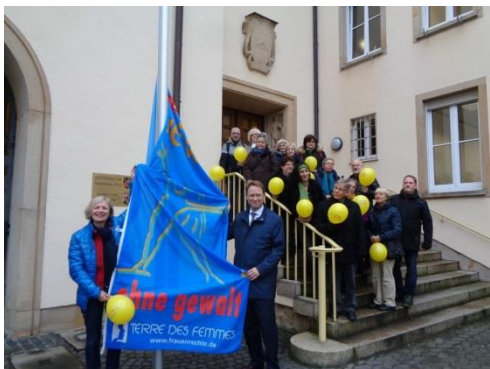
... Fahnenhissen vor dem Rathaus ...