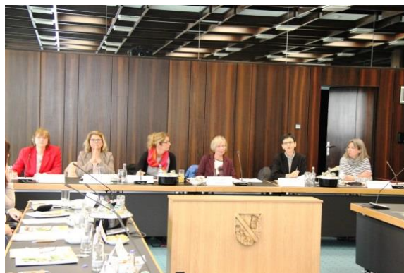
... das LAG-Sprecherinnen-Team ...