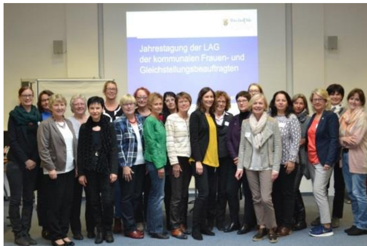
... die Mitglieder der LAG zu Gast bei Frauenministerin Anne Spiegel ...

Einmal jährlich lädt das Ministerium für Familie, Frauen, Jugend, Integration und Verbraucherschutz Rheinland-Pfalz die hauptamtlichen kommunalen Frauen- und Gleichstellungsbeauftragten zum gegenseitigen Informations- und Meinungsaustausch ein.