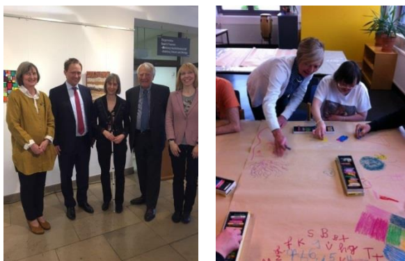
... Gäste aus Colombes ... ... Blick in die Malwerkstatt ...

Sie war bei der Eröffnung der Ausstellung von Künstlerinnen und Künstlern des Vereins APEI – Verein der Freunde und Eltern geistig behinderter Kinder aus der Partnerstadt Colombes zugegen, begleitete die Gäste in die Oggersheimer Betriebsstätte der Ludwigshafener Werkstätten und nahm begeistert an der gemeinsamen Malwerkstatt teil.