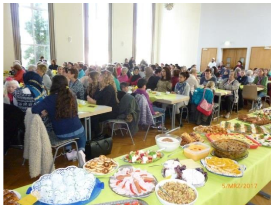
... die Gäste ...