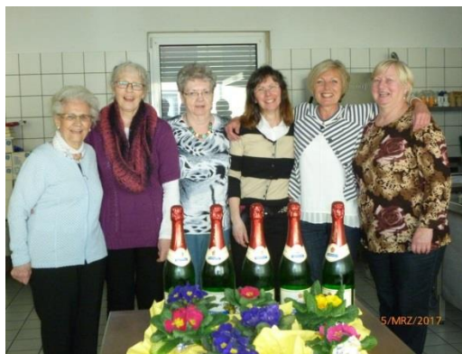
... ein Teil des Helferinnen-Teams ...