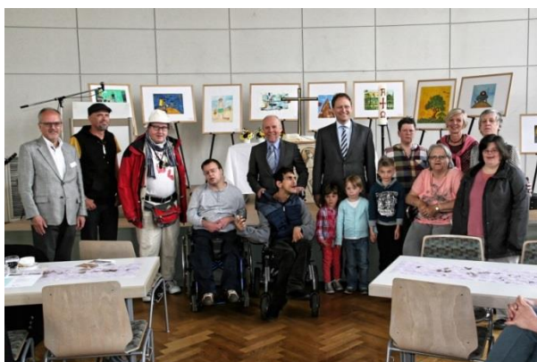
... Gruppenfoto mit den prämierten Kunstschaffenden ...

Auf Einladung des Protestantischen Dekanats Frankenthal war die Beauftragte für die Belange behinderter Menschen bei der Eröffnung der Wanderausstellung „Behinderte Menschen malen 2017“ zu Gast. Präsentiert wurden über 100 Bilder, die von Menschen mit Behinderung aus Werkstätten und Einrichtungen in Rheinland-Pfalz zum Thema „Traumreise“ gemalt haben.