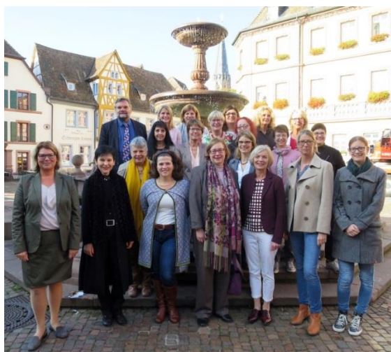
... zu Gast in Neustadt a.d. Weinstraße ...