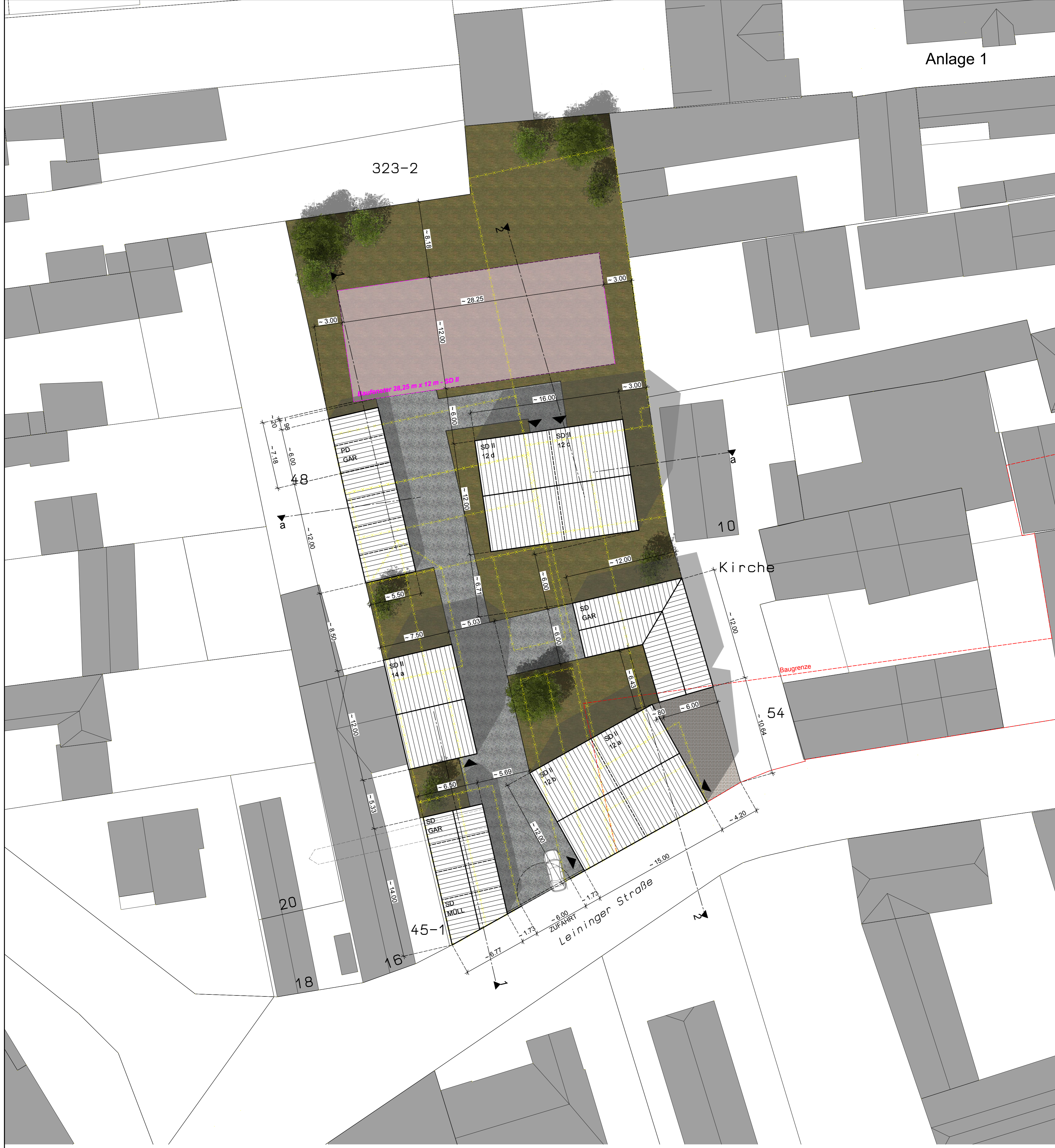
Lageplan | 1_200