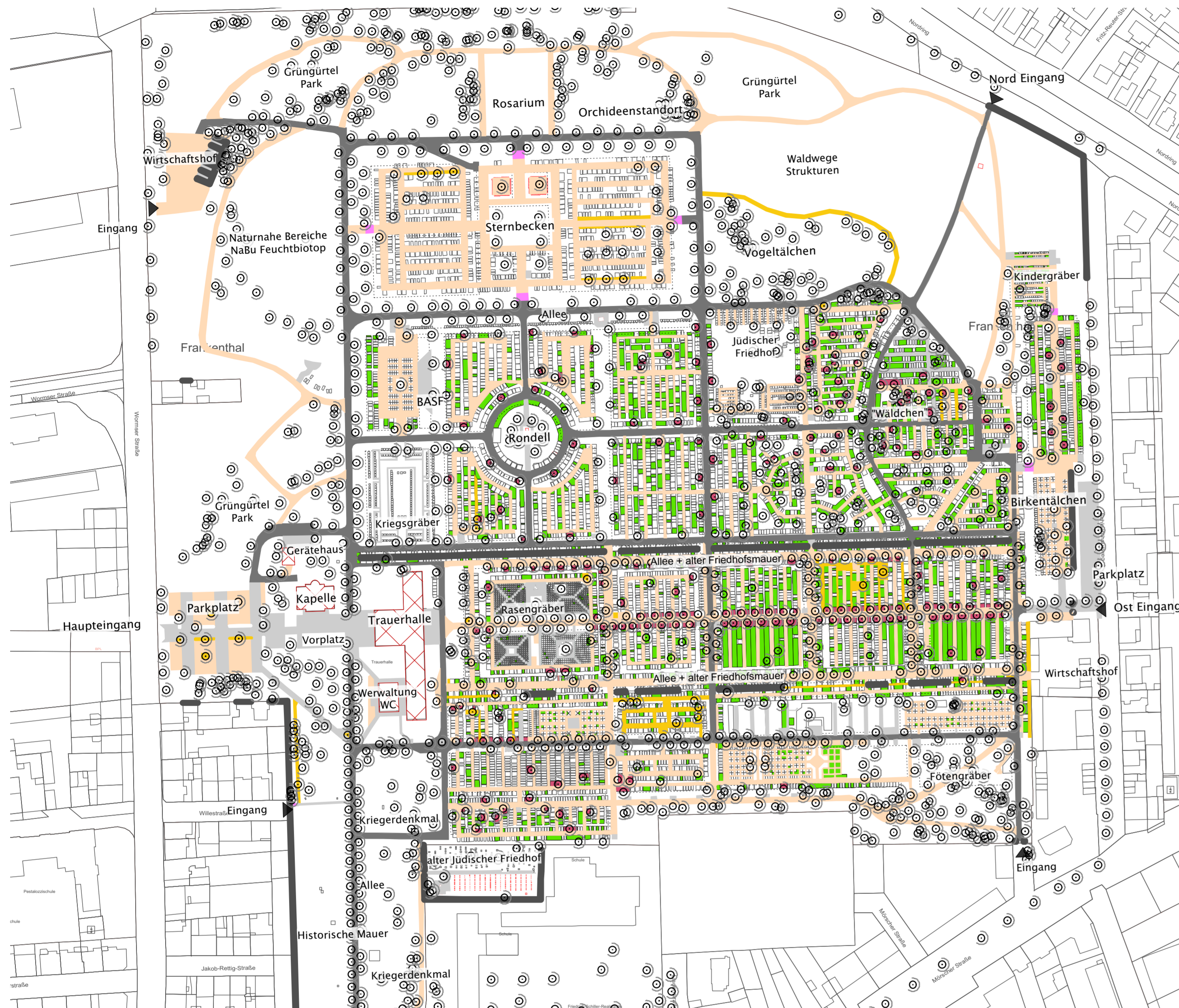
01 Bestandsplan mit Analyse der Freiflächen M 1:1500 Grundlage basierend auf GIS Daten Stand 19.10.2018 Stadtverwaltung Frankenthal