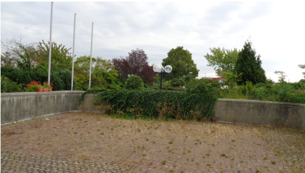
Abbildung: Geplanter Standort für die VRNnextbike-Abstellanlage Stadtklinik

Es wird davon ausgegangen, dass die Nachfrage nach einer Station Stadtklinik höher ist als die Nachfrage bei einer Station Konrad-Adenauer-Platz.