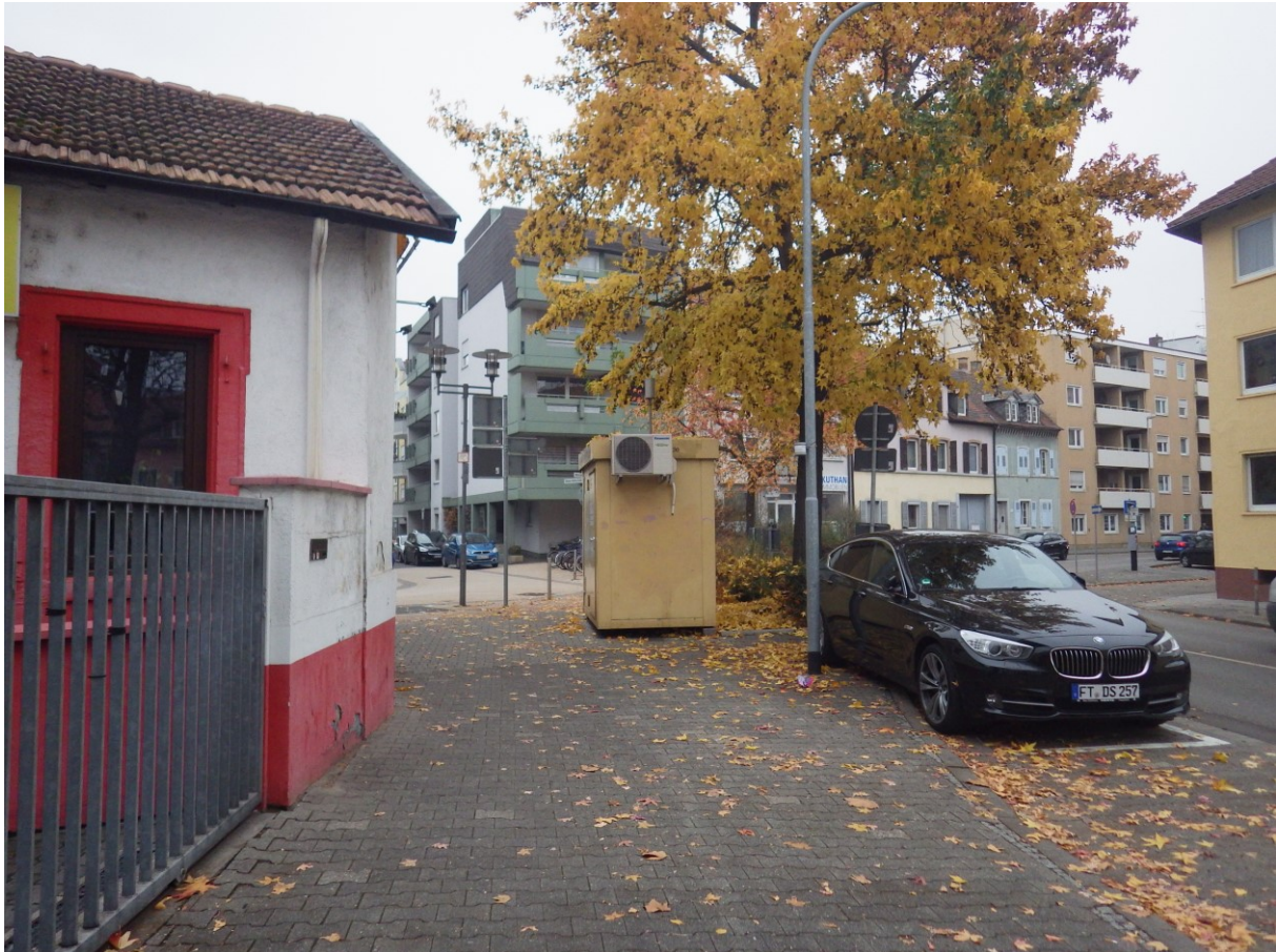
Abbildung: Geplanter VRNnextbike-Standort am Europaring (links neben dem parkenden Kfz)

Am Europaring lässt sich eine größere Station (6er-Station) als in der Mühlstraße realisieren, zudem besteht dort weniger die Gefahr von Anfahrschäden durch parkende Kfz.