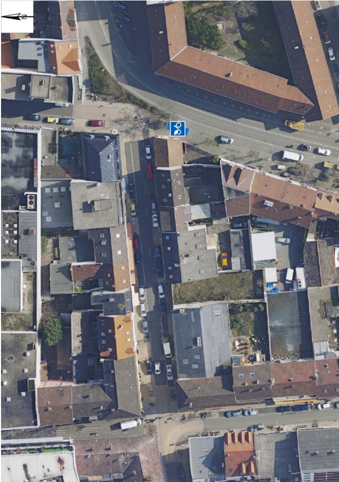
Karte: Geplanter Standort der VRNnextbike-Station Europaring