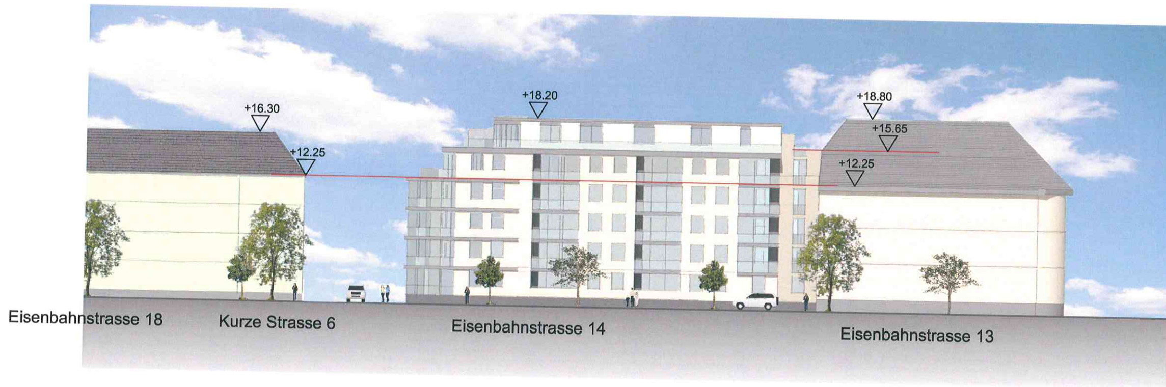
ABWICKLUNG EISENBAHNSTRASSE WESTANSICHT