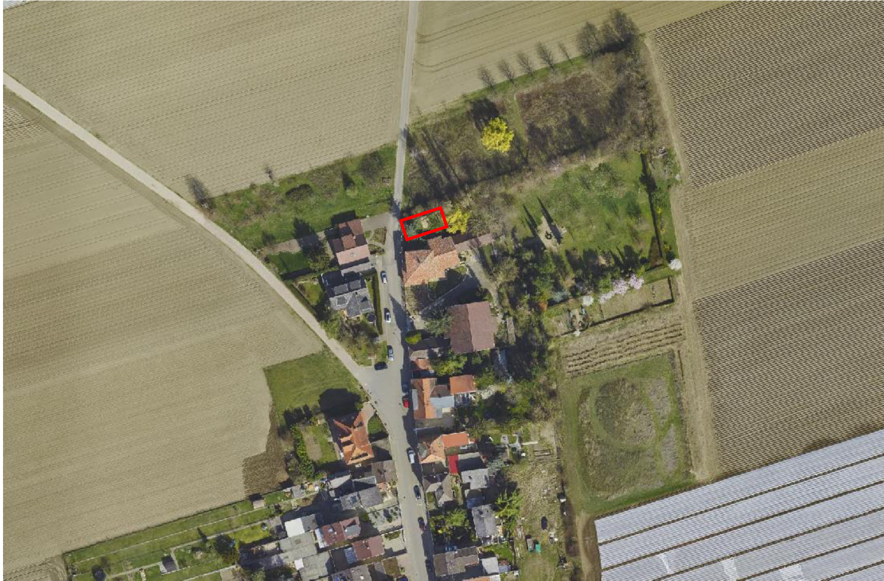
Anlage 1 Luftbild o. M. Bereich des Vorhabens