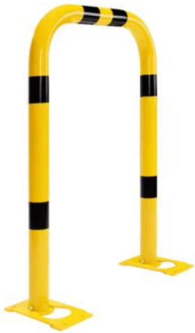
Schutzbügel (Ø7,6cm , 75x115cm)