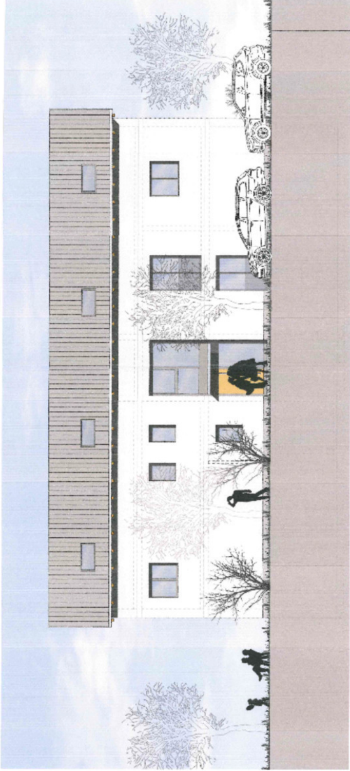
Ansicht Nord M. 1:100