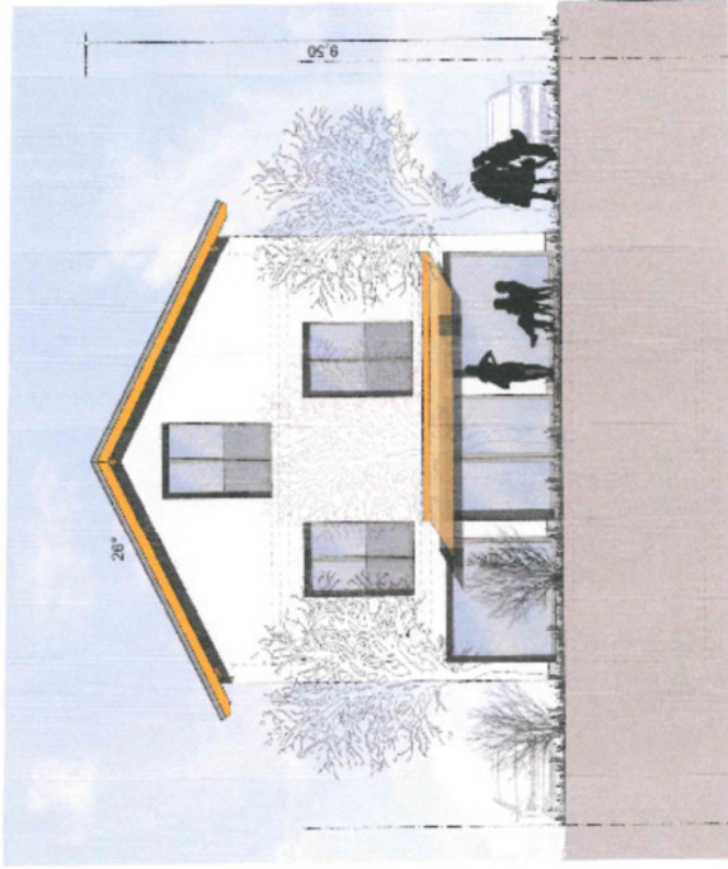
Ansicht West, Garten M. 1:100