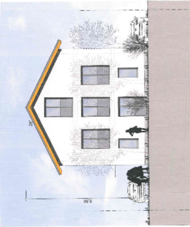
Ansicht Ost, Strasse M. 1:100