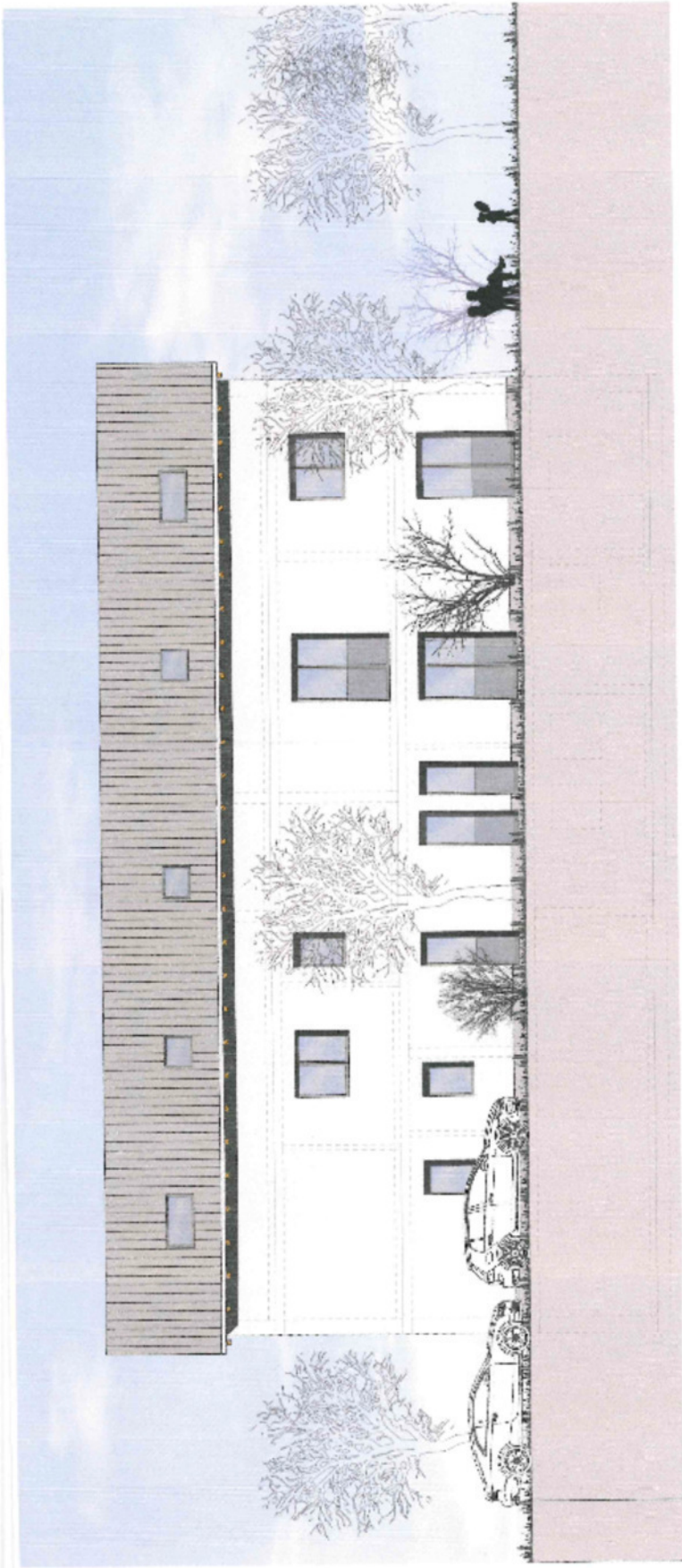
Ansicht Süd M. 1:100