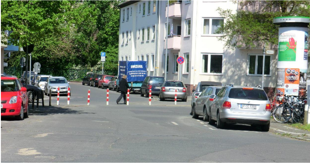
Abbildung 5: Diagonalsperren in Wohnstraßen