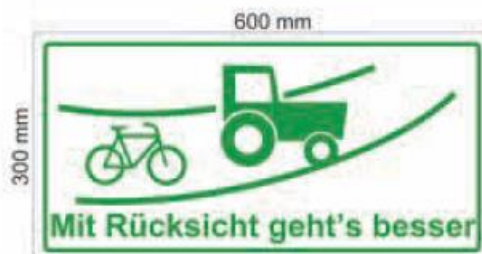
Abbildung 4: Kleines Zusatzschild, Beispiel aus den HBR 2014 (Hinweise zur wegweisenden und touristischen Beschilderung für den Radverkehr in Rheinland-Pfalz)

Es wird entsprechend vielfach erforderlich sein, auf ein besseres Miteinander der Akteure hinzuwirken. Dafür können bspw. Hinweis-Schilder eingesetzt werden (siehe Abbildung 4 ).