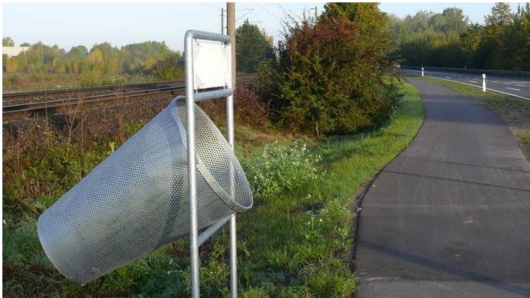
Abbildung 3: Schräg ausgerichteter Mülleimer als (wiedererkennbares) Ausstattungsmerkmal eines Radwegs.