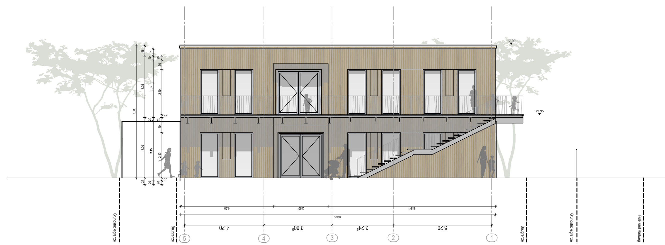
Gebäude A_Ansicht Nord