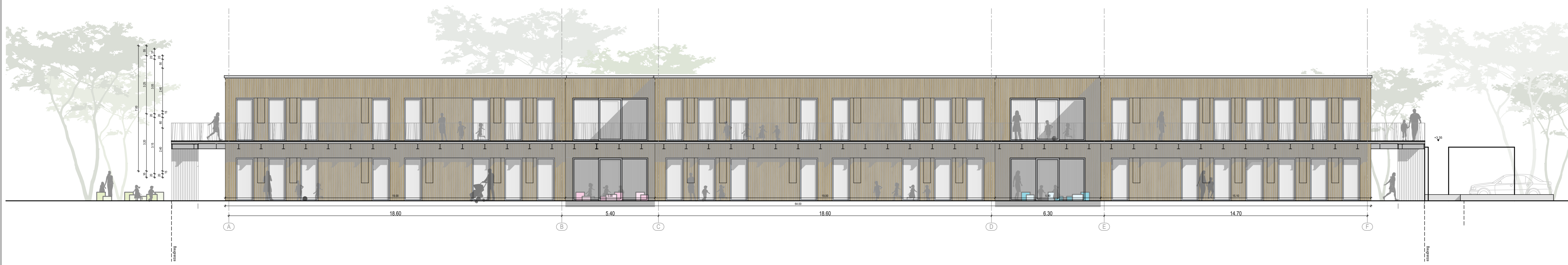
Gebäude A_Ansicht West