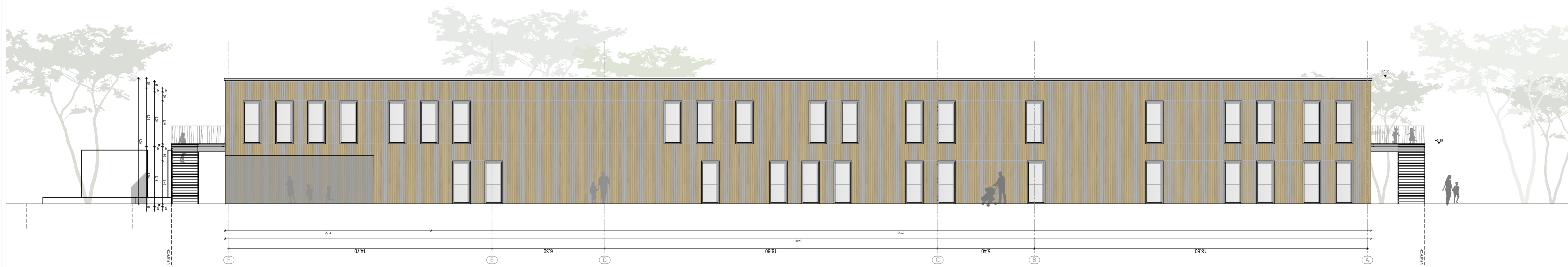
Gebäude A_Ansicht Ost