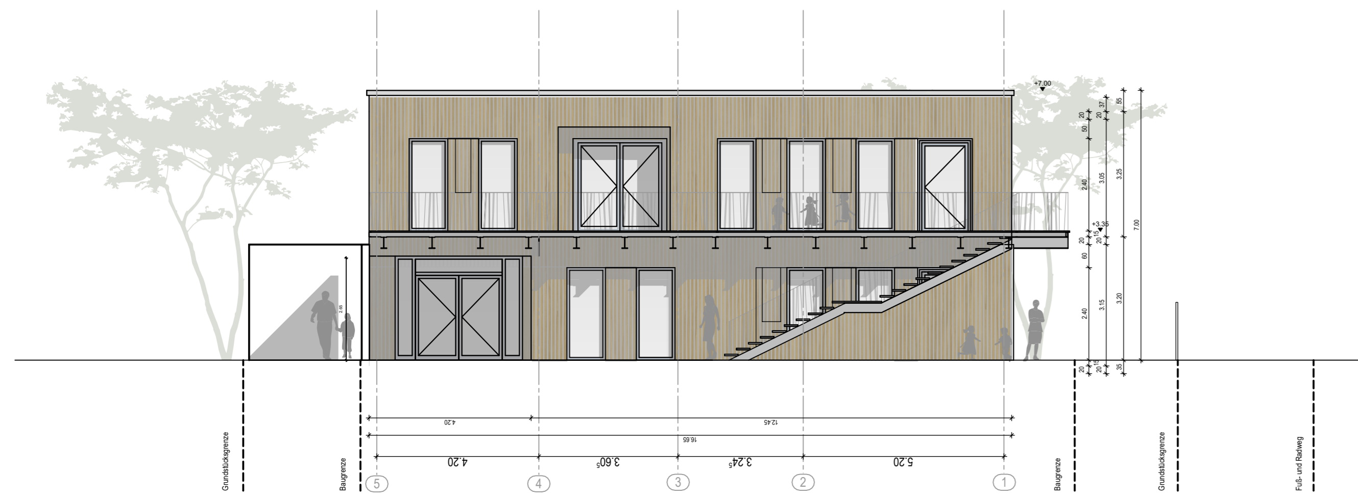
Gebäude A_Ansicht Nord