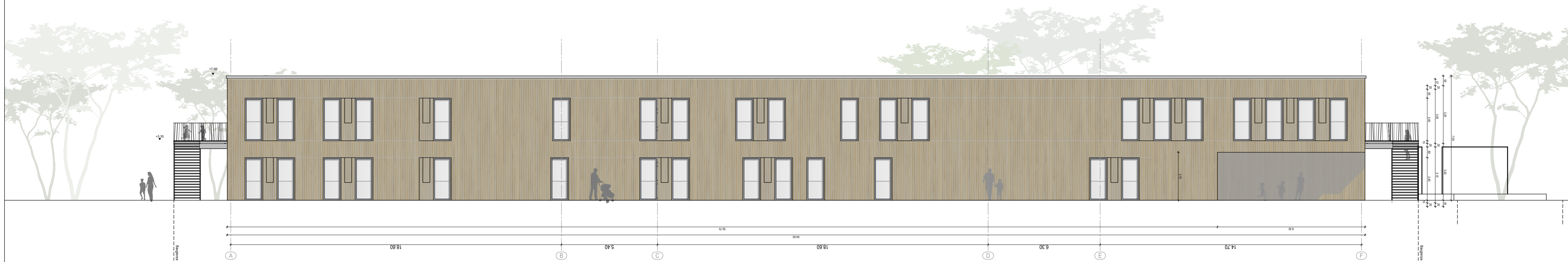
Gebäude A_Ansicht Ost