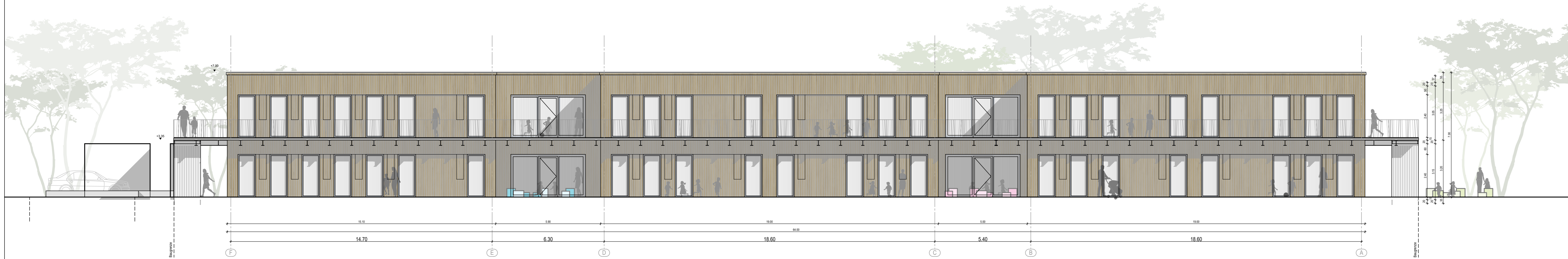
Gebäude A_Ansicht West