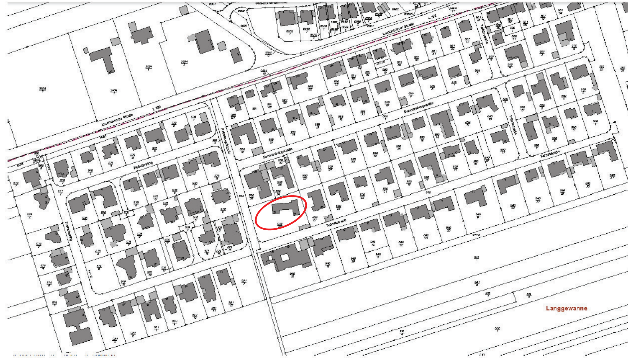
Abb. 2: Lage-/Schwarzplan der weiteren Umgebung o. M.