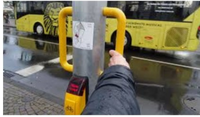
Gießen: Erster Schritt zur Fahradstraße | Gießen