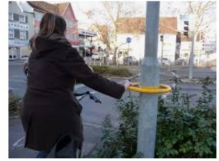
Mehr Komfort für Radfahrer | Stadt