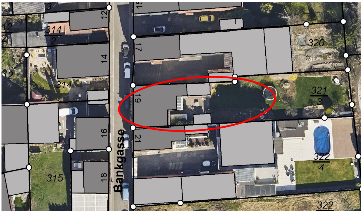
Abb. 2: Luftbild der näheren Umgebung o. M.