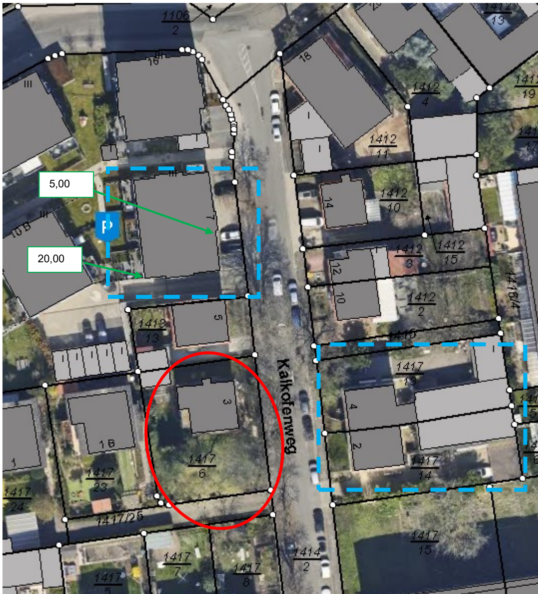
Abb. 2: Luftbild Detailausschnitt der näheren Umgebung o. M.