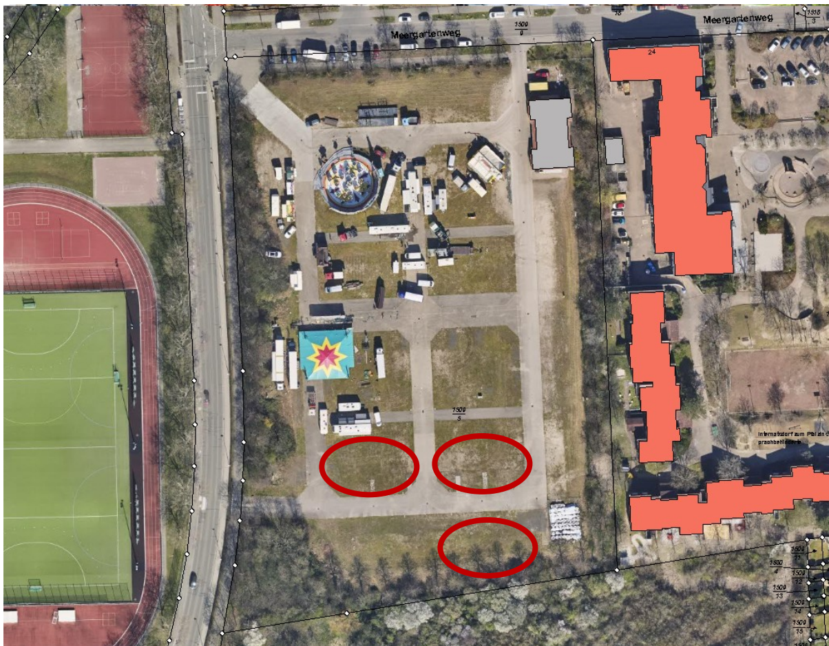
Abb. 1 Luftbild des Vorhabengrundstück und der Umgebung

Die Stadtverwaltung Frankenthal möchte als Bauherr auf dem Grundstück mit der Flurstücksnummer 1509/5 in der Straße Meergartenweg in Frankenthal Containeranlagen zur Unterbringung von Flüchtlingen errichten. Hierzu stellt sie den Antrag, auf dem Festplatz zwischen Meergartenweg und Benderstraße insgesamt vier Containeranlagen mit den Abmessungen von jeweils 12,25 m x 14,53 wie dargestellt zu errichten. Die Containeranlagen sollen auf 1 Jahr befristet werden.