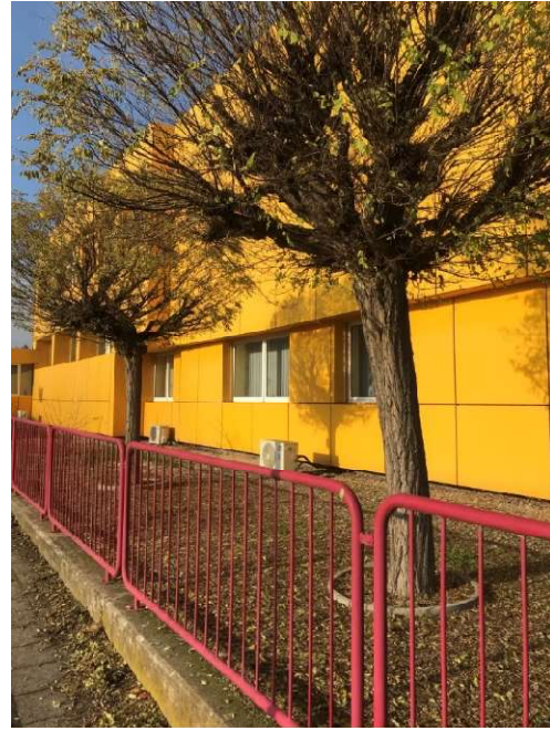
Abb. 5: Kugel-Robinie als Einzelbäume (eigene Aufnahme 18.12.2018)