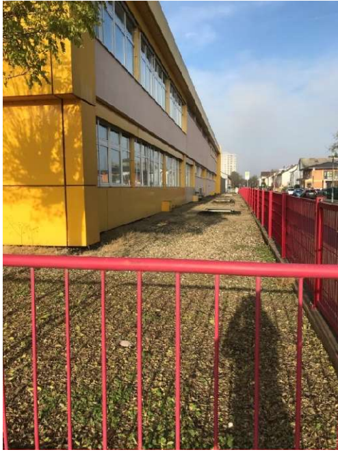
Abb. 4: Gebäudebestand (eigene Aufnahme, 18.12.2018)