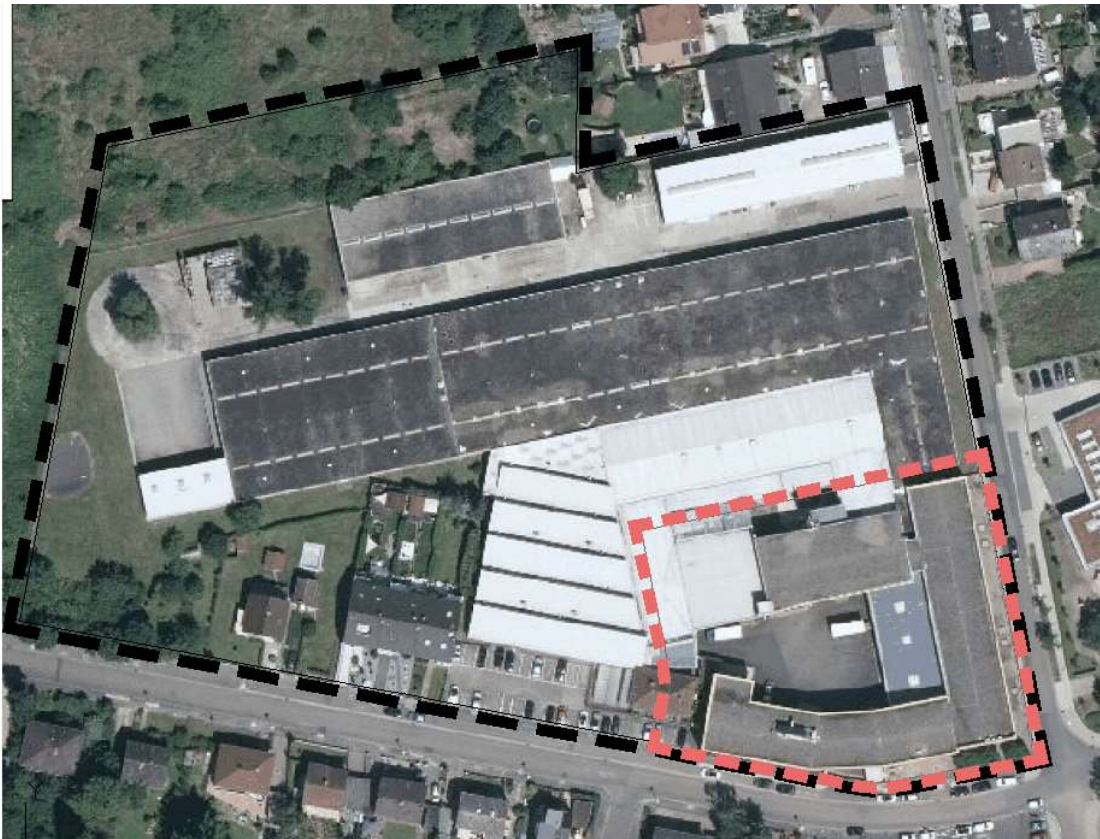
Abb. 3: Gesamtplangebiet (schwarze Linie) und Geltungsbereich des Bebauungsplans (rote Linie)