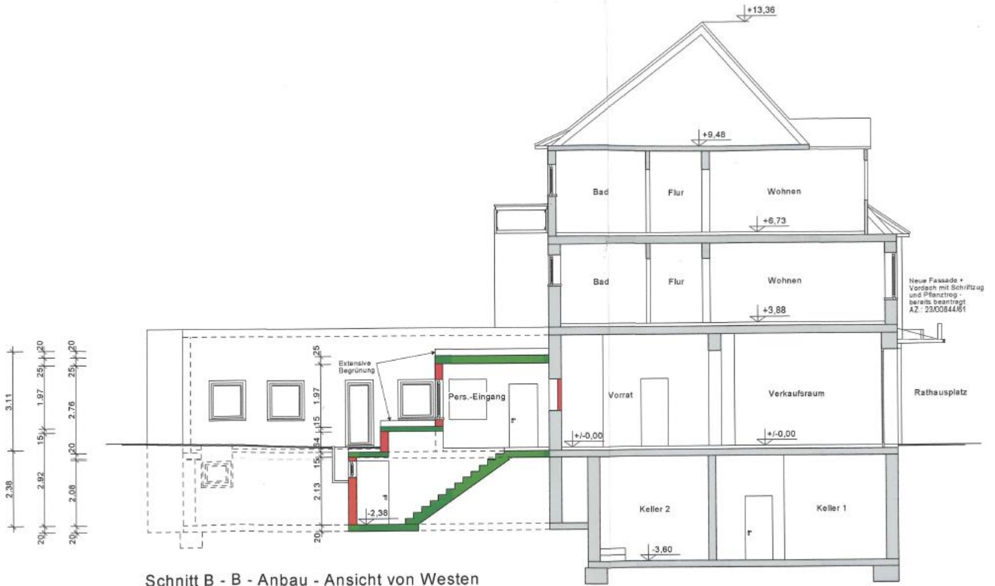
Schnitt B - B - Anbau - Ansicht von Westen