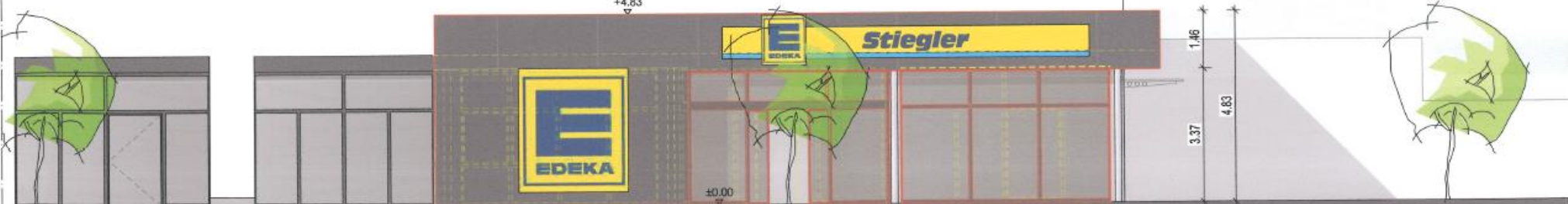
Ansicht Südwest (Foltzring)