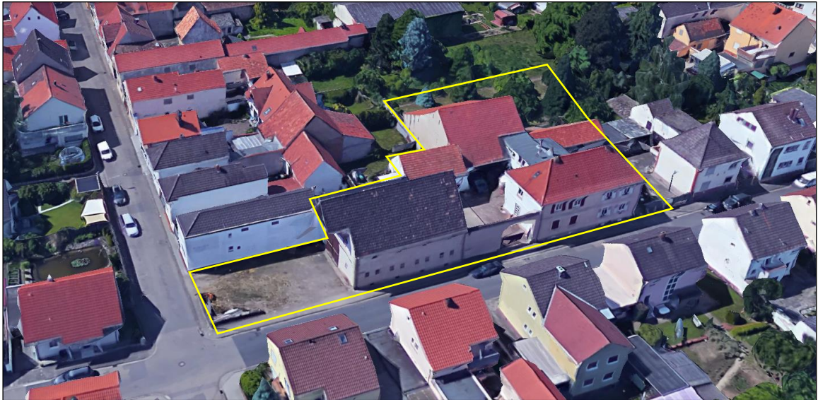
Ansicht des Planungsgebiets von Norden.