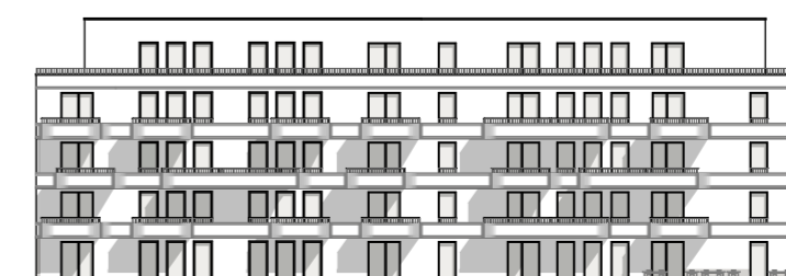
ANSICHT SÜD - Weißmodell 1:500