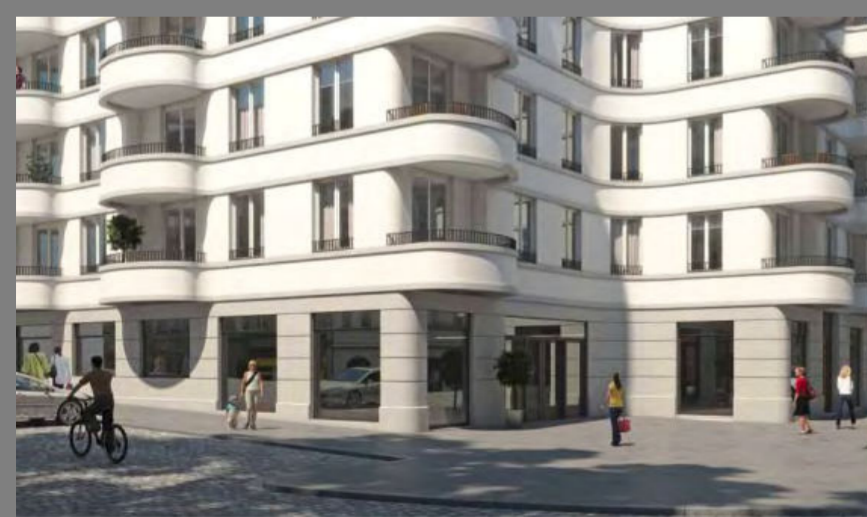
Referenz : Rigaer Str. 67, Berlin