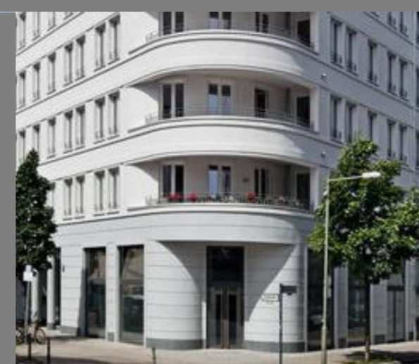
Referenz : Internetrecherche ( https://www.pinterest.de/pin/3391780342745285/ )