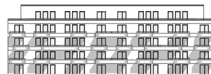
ANSICHT SÜD - Weißmodell 1:500