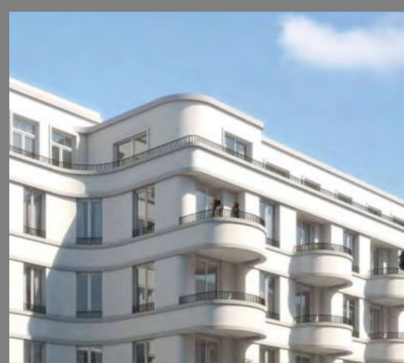
Referenz : Rigaer Str. 67, Berlin